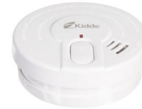
Système de sécurité