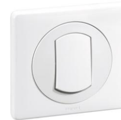
Appareillage du bâtiment