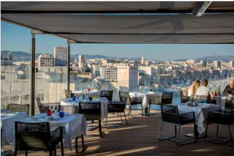
Sofitel Marseille Vieux Port