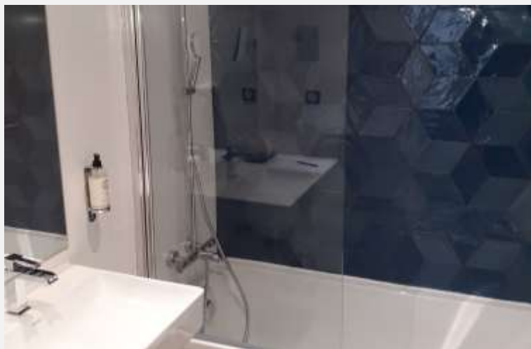
Best Western Poitiers Rénovation salles de bain