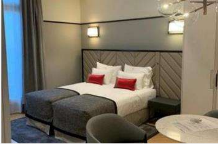
Le Claridge – Fraser Suites