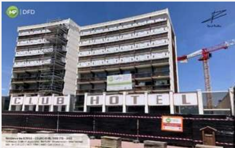
Hôtel Les Ecrins Désamiantage