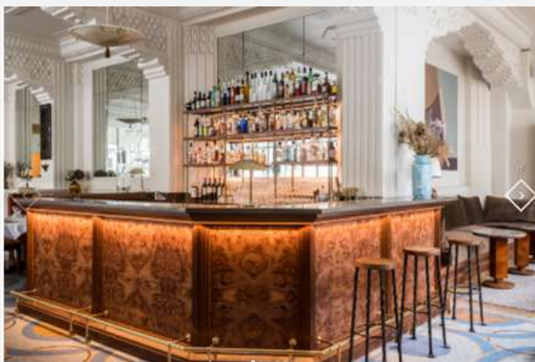
Hôtel Rochechouart 4* Rénovation chambres, restaurant