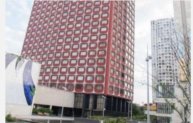
Novotel Paris Tour Eiffel Désamiantage