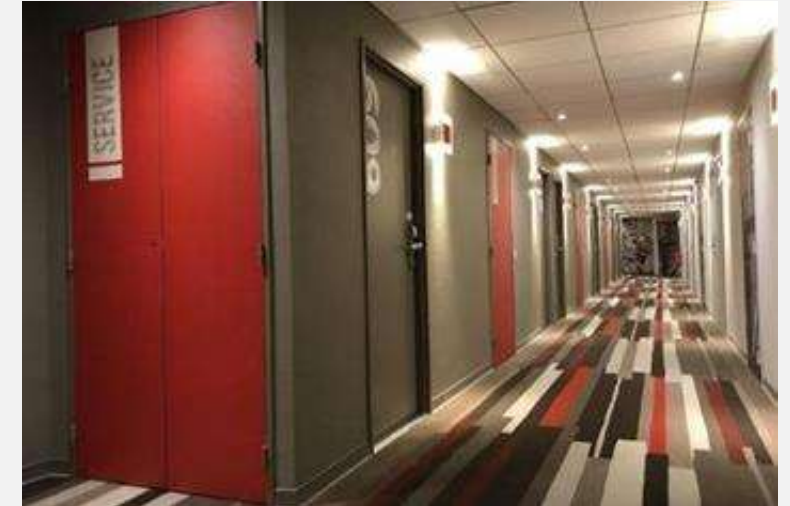
Photo 3 Rénovation chambres et circulations