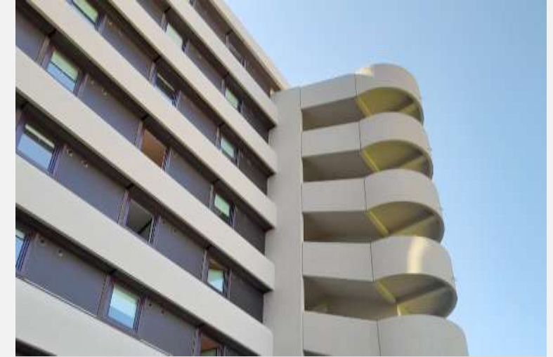
Hôtel ibis budget Toulouse Dépose pierres de parements en façades + restructurations et application d'un enduit