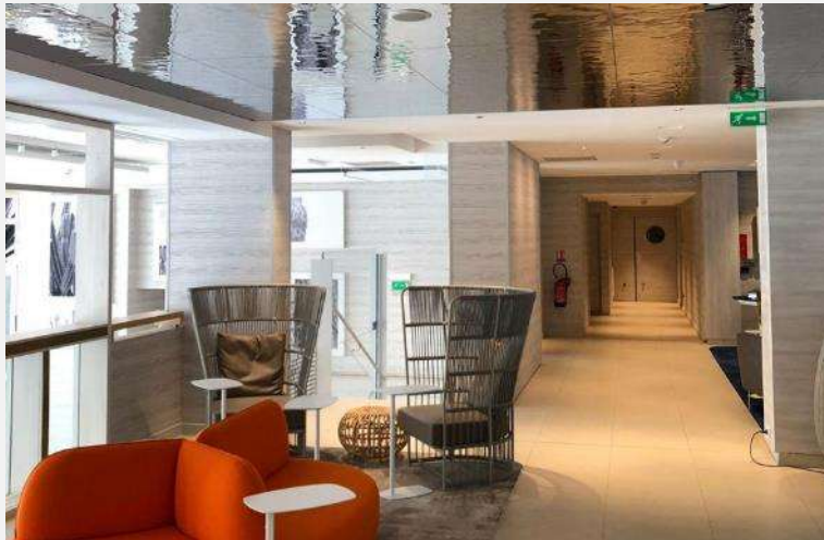
Novotel Monte Carlo