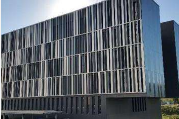
Hôtel Solidarités Reims