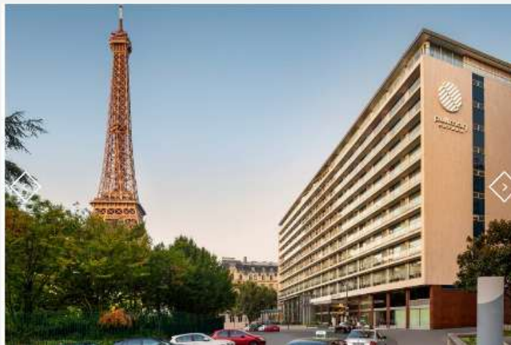
Hôtel Pullman Tour Eiffel 4* Rénovation chambres, parties comm.