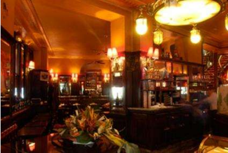
Projet Hôtel 1 Travaux renovation