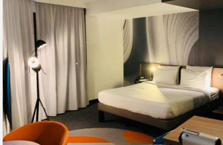
Novotel Paris Vaugirard Rénovation chambres