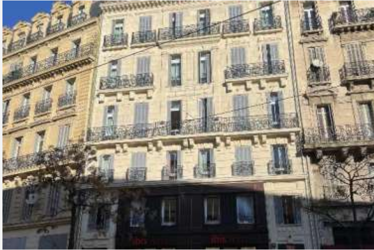
Ibis Budget Marseille Centre Bourse Traitement pierre sur immeuble ancien