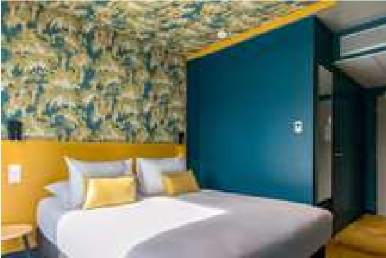
Ibis Styles Dijon Sud