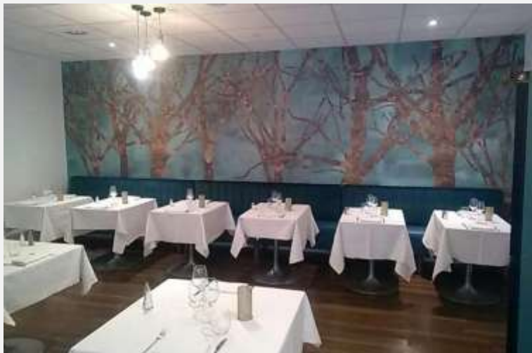
Hôtel Les Remparts Rochefort Restaurant 200c. + rénovation 69 chambres