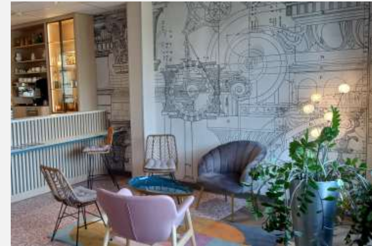
IBIS STYLES Chinon Rénovation restaurant et accueil