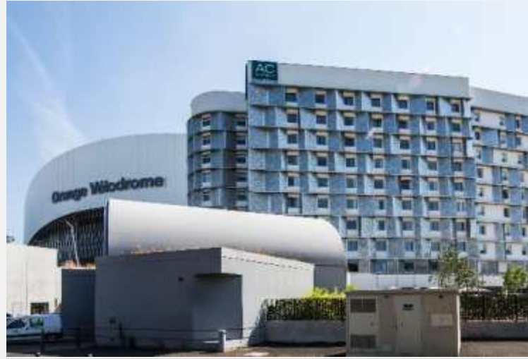
Hôtel Mariott Marseille Isolation Thermique par l'Extérieur