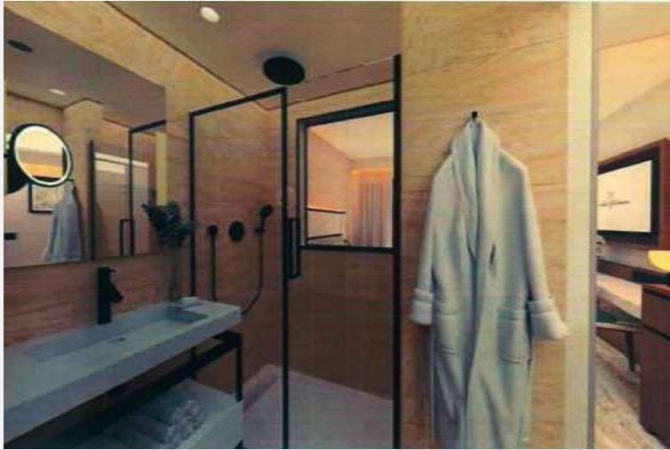
Hôtel Gray Albion Cannes