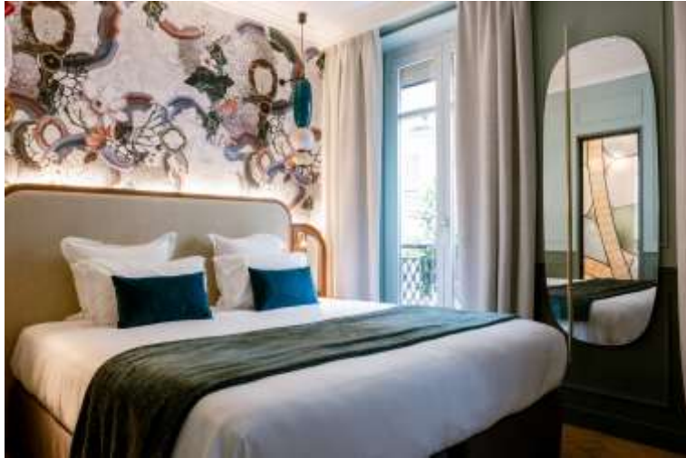
Grand Hôtel Saint Michel