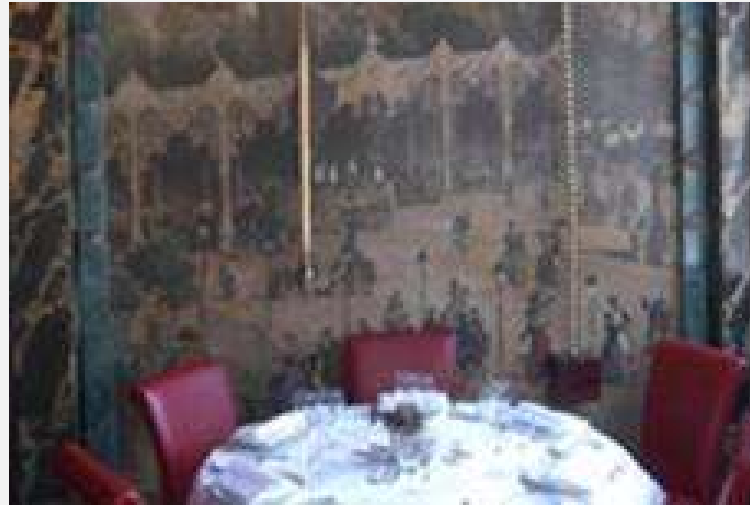
Projet Hôtel 2 Renovation parties communes