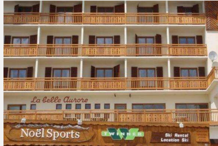
Hôtel La Belle Aurore Alpes d'Huez Désamiantage