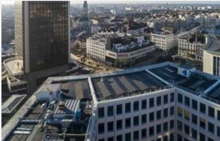
Hôtel des Postes Nantes