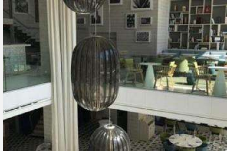
Novotel Monte Carlo