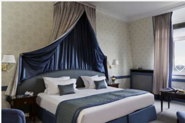
Hôtel Grand Barrière 5* Rénovation chambres