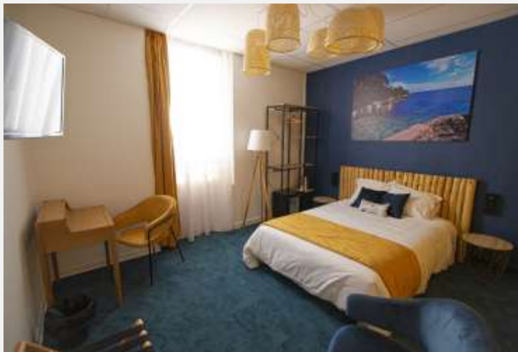
Hôtel Atlantis Cannes 3* Rénovation chambres