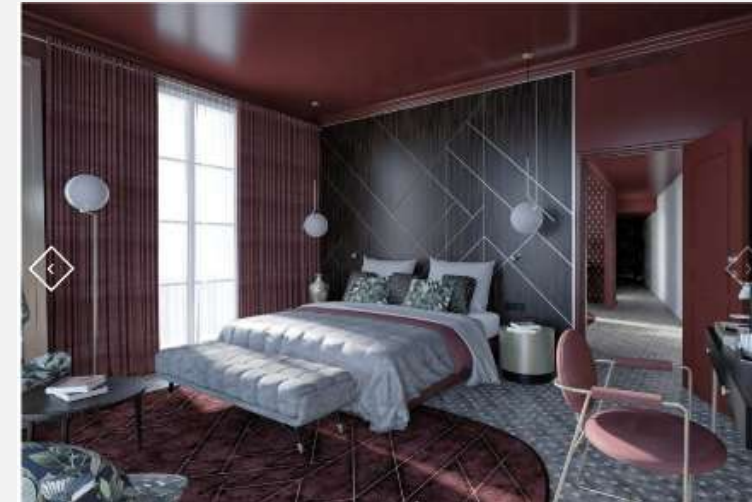
Hôtel Aigle Noir 4* Rénovation chambres