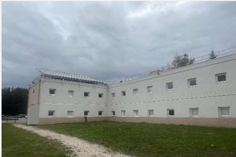
F1 Fernay Voltaire Ravalement façades