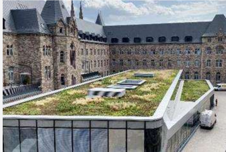
Hôtel des Postes Strasbourg