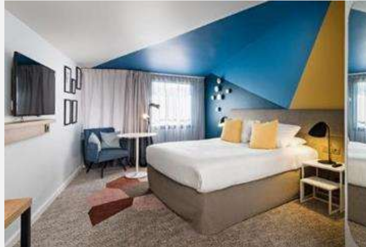
Photo 2 Rénovation chambres