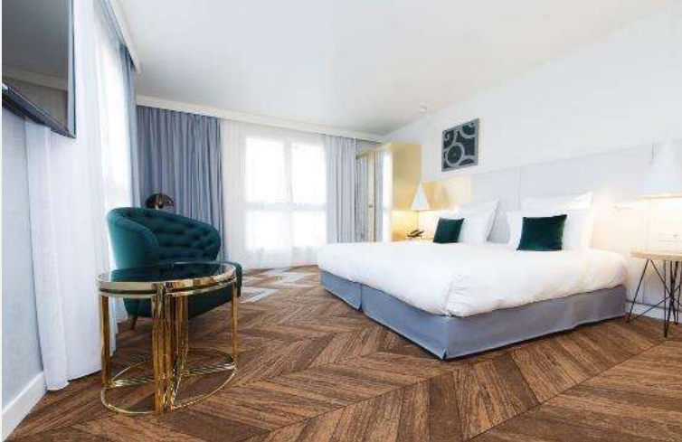
Hôtel Mgallery Versailles Rénovation chambres