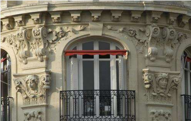
Projet 4 Ravalement de façade