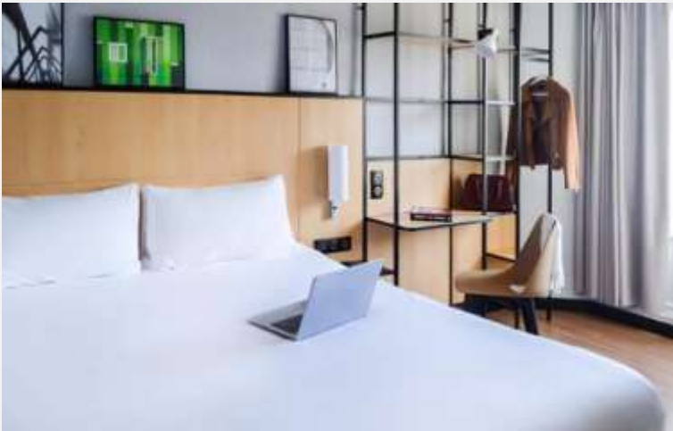
Ibis Tour Eiffel Rénovation chambres