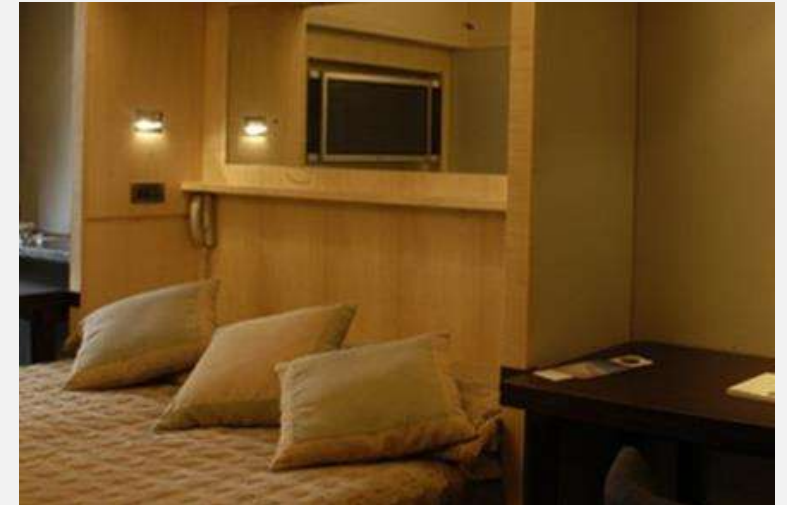
Projet Hôtel 3 Renovation chambres