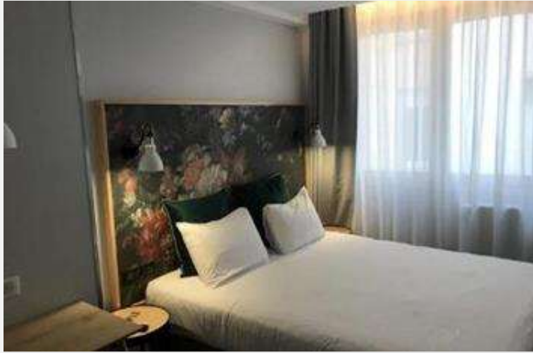
Photo 1 Rénovation chambres