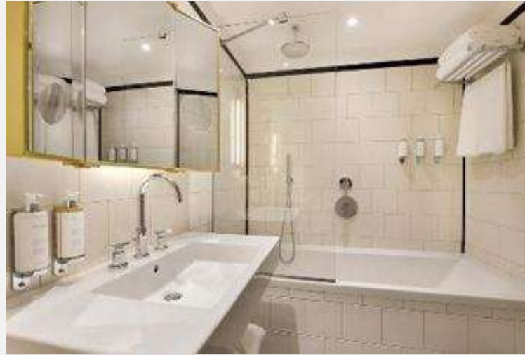
Hôtel L'Echiquier Opéra Paris