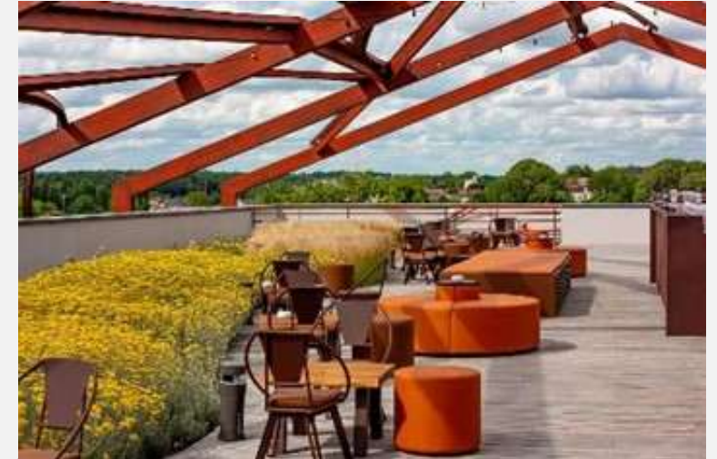
Hôtel Chais Monnet Cognac