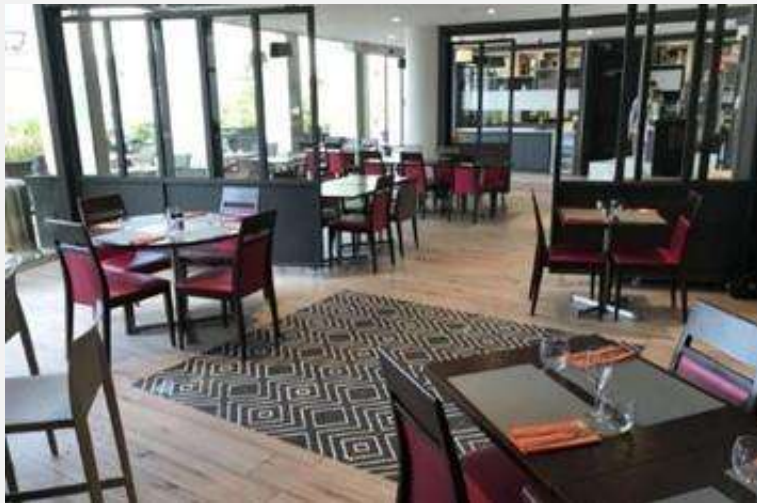
Photo 4 Rénovation parties communes