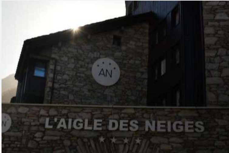
Hôtel L'Aigle des Neiges. Val d'Isère Désamiantage