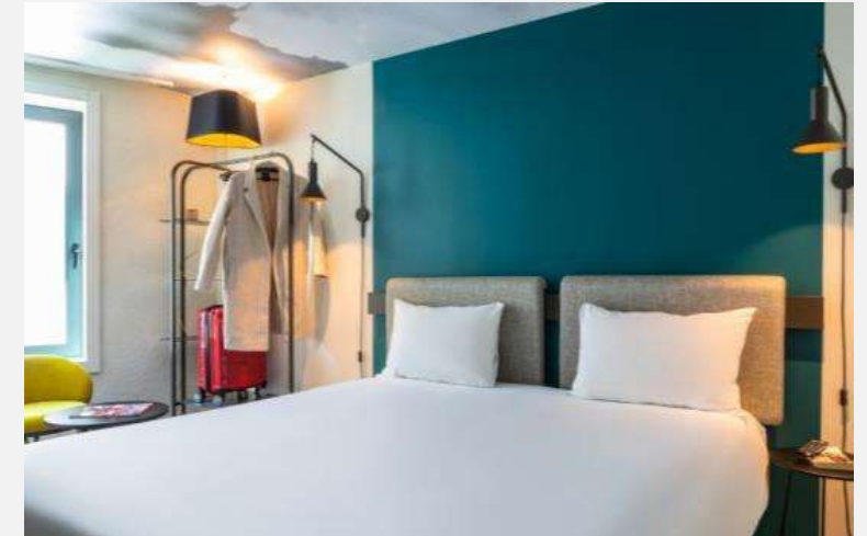
Ibis Coeur d'Orly Rénovation chambres