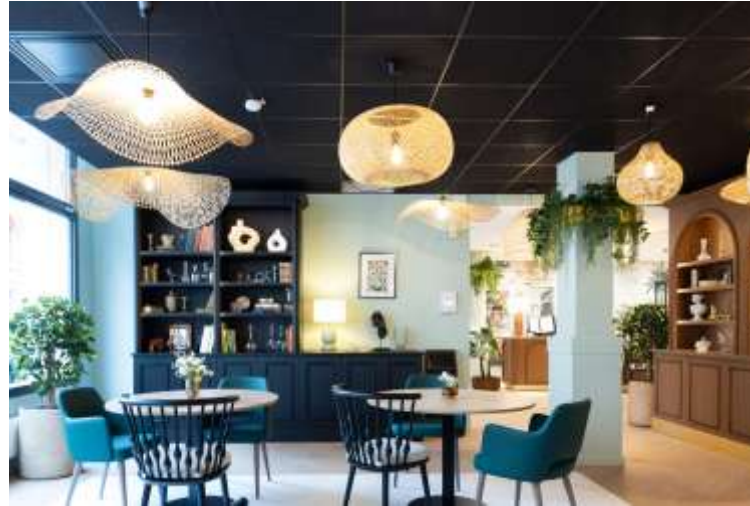
Korian Champ de Mars